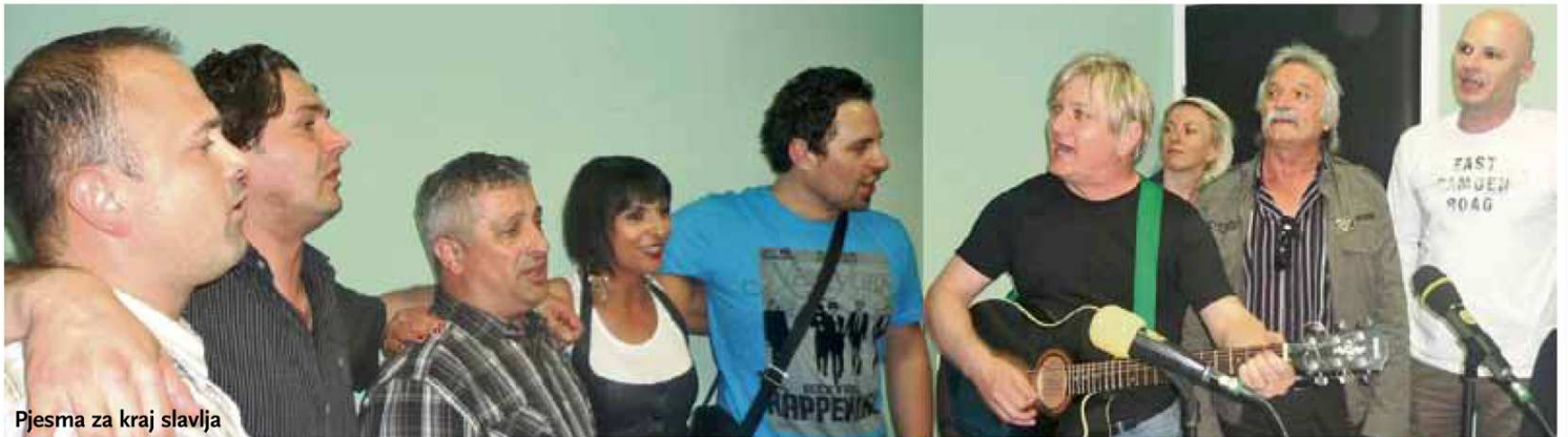
Pjesma za kraj slavlja